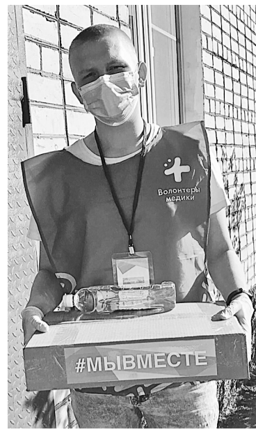
Боровичские волонтеры развезли 1490 бесплатных продуктовых наборов