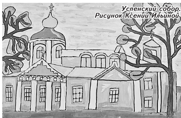
Успенский собор. Рисунок Ксении Ильиной